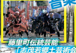
藤里町伝統芸能「志茂若郷土芸術会」