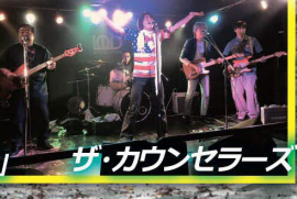
ザ・カウンセラーズ